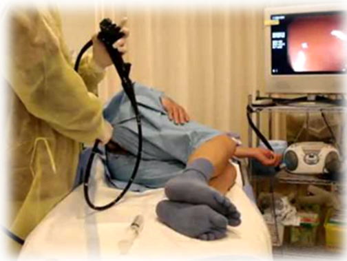
Изображение №2. Кабинет колоноскопии

Большое число опухолей выявляется на поздних стадиях. Причина - поздняя диагностика. Так завелось, что если ничего не беспокоит, то нет необходимости обращаться к врачу. В этом и есть коварство злокачественных опухолей.